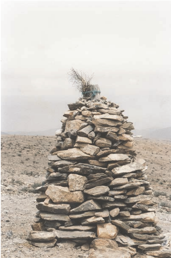
Figure 3 : Cairn de saint dans la région d'Illigh

Ici, l'aspect fonctionnel et symbolique du cairn fusionnent totalement. Car les cairns d'un saint marquent aussi l'étendue de son charisme, son horm , notion à la fois géographique, historique et spirituelle, dérivée du terme arabe haram (« interdit »). Le horm correspond au territoire d'influence du saint, là où sa baraka (bénédiction divine) et sa malédiction agissent notamment par l'intermédiaire des djinn . Chaque cairn est en effet positionné à un endroit bien précis que le saint a choisi d'être un point de contact entre le monde des humains et celui des djinn . Plus précisément, les cairns témoignent de l'emprise du saint sur le territoire, et sur les djinn du lieu qui « travaillent » désormais pour lui. Ici, le cairn de saint n'est pas tant un point de rupture, qu'un point de contact faisant office de lieu de passage entre les deux mondes.