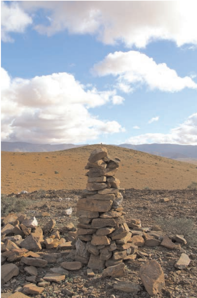
Figure 4 : Cairns en enfilade autour de Sidi Ahmed ou Moussa, région de Tiznit

régions montagneuses comme celles du Souss ou du Haut Atlas, prier le saint au cairn n'a de sens que parce que l'on est dans la perspective visuelle de son mausolée, l'offrande au saint n'étant possible que si l'on a en vue son tombeau ou un de ses relais. De la sorte, prier près d'un cairn de saint en regardant au loin un autre cairn du même saint situé en hauteur et d'où l'on aurait, si on y était, une vue nette sur le mausolée lui-même, équivaut à être physiquement en train de le visiter. Cette perspective permet aussi à ceux qui ne peuvent pas se rendre à pied au mausolée du saint le jour du mousssem , comme les femmes enceintes, les personnes âgées et les handicapés, de le célébrer en organisant, à l'une ou l'autre de ces « ambassades », un rituel de commensalité ( maârouf ). Les cairns de saints permettent au visiteur de se transposer par le regard dans l'espace du mausolée, pôle central de la baraka . Chacun de ces observatoires permet d'embrasser par la vue un espace qui correspond à la zone d'influence d'un saint, le territoire où sa renom-