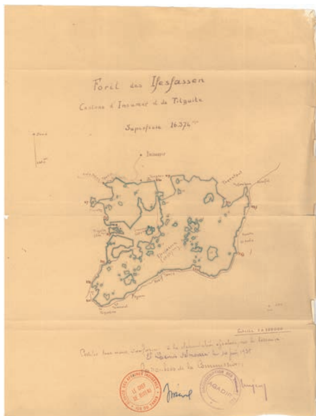
Figure 7 : Carte de délimitation de la forêt des Ifesfassen présentant de nombreuses clairières

La borne peut être construite en pierre sèche, généralement un cairn cylindrique de près de 60 centimètres de diamètre et 80 centimètres de haut, avec le numéro de la borne inscrit du côté opposé à la forêt. Elle peut également être confectionnée en béton armé avant sa mise en place (figure 8). Les bornes sont accompagnées de deux fossés ou murettes de direction, d'environ un mètre de long de part et d'autre de la borne et indiquant la direction des bornes voisines. Les bornes sont levées au fur et à mesure de leur pose avec des appareils topographiques des plus rudimentaires au début aux plus sophistiqués actuellement, pour avoir le plan de la forêt délimitée. Certaines forêts sont délimitées sans indication de l'orientation (en degré ou en grade) avec pour seule information la distance et la direction entre deux bornes successives (N-NE par ex), ce qui rend la recherche d'une borne disparue très difficile, voire impossible, surtout si la distance entre les bornes est importante. Quand le travail est fait par des géomètres professionnels, le levé porte sur les coordonnées de la borne et son rattachement au système géodésique, donnant au travail une