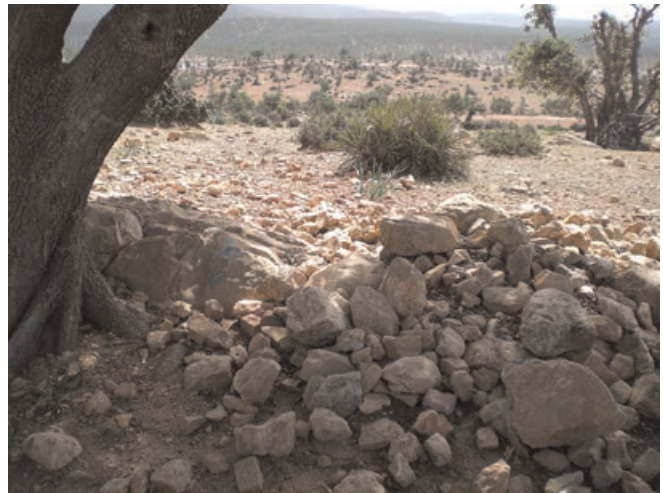
Figure 9 : Borne de délimitation forestière ritualisée à Imi n Tlit (Romain Simenel 2009)