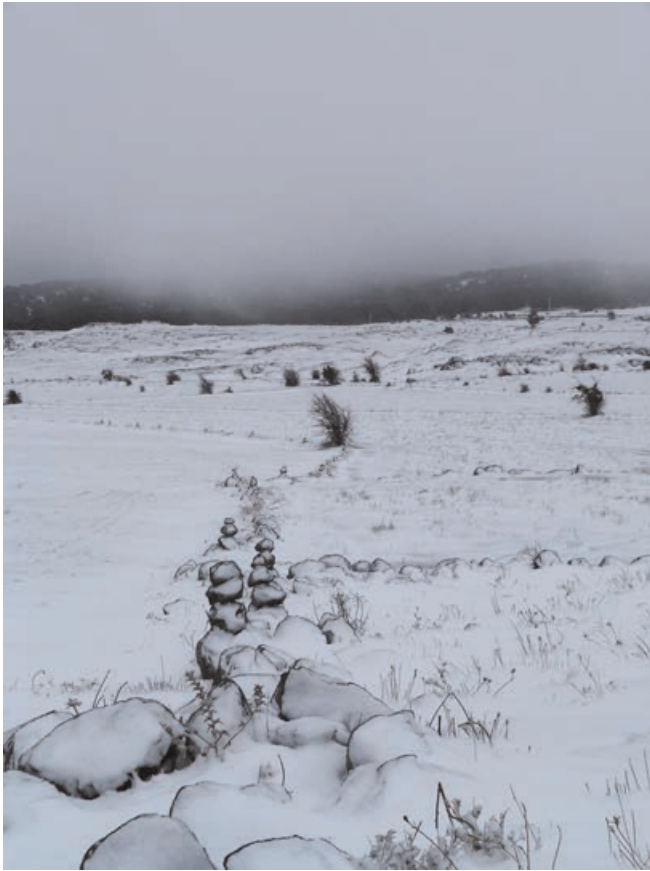
Figure 1 : Une succession de cairns marque la limite entre des champs dans la région d'Ifrane (Romain Simenel 2011)

du Maroc, déterminé en partie par les indications présentes dans les titres d'héritage, rrsom , établis de manière coutumière par des clercs ( a'dul ) ou des juges ( cadî ). Dans ces titres, les limites des surfaces des parcelles sont indiquées grâce à la référence aux limites des surfaces voisines et aux toponymes désignant les particularités du relief. Le plus souvent le territoire est découpé en bandes partant de l'espace habité jusque-là où le relief permet une mise en culture, y compris en terrasses. Mais les papiers de propriétés ne distinguent pas les usages de la terre, ni donc les surfaces agricoles des surfaces forestières. Ce faisant, le bornage des droits d'usages dans la forêt s'inscrit souvent dans la continuité du bornage des surfaces agricoles, comme c'est souvent le cas dans l'arganeraie (figure 2). De surcroît, les pratiques d'héritages renforcent souvent la continuité entre les droits sur les terres agricoles et les droits d'usages sur les forêts, en recourant notamment à l'échange de terres et à l'exhérédation des femmes afin d'assurer l'indivision au sein d'une même bande. Dans la pratique des populations locales, les cairns ont donc pour fonction de délimiter soit des parcelles de propriété