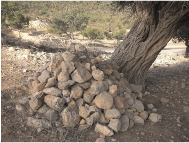
Figure 10 : Borne 29 du domaine forestier d'Imi n Tlit (Romain Simenel 2009)