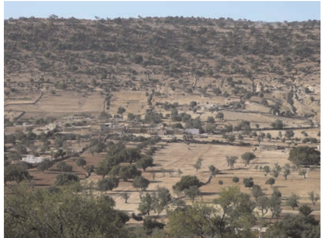
Figure 2 : Finage du douar Aït Ahmed dans la région d'Es-saouira où l'on distingue le prolongement des lignes de cairns vers la forêt d'arganiers

du Maroc, déterminé en partie par les indications présentes dans les titres d'héritage, rrsom , établis de manière coutumière par des clercs ( a'dul ) ou des juges ( cadî ). Dans ces titres, les limites des surfaces des parcelles sont indiquées grâce à la référence aux limites des surfaces voisines et aux toponymes désignant les particularités du relief. Le plus souvent le territoire est découpé en bandes partant de l'espace habité jusque-là où le relief permet une mise en culture, y compris en terrasses. Mais les papiers de propriétés ne distinguent pas les usages de la terre, ni donc les surfaces agricoles des surfaces forestières. Ce faisant, le bornage des droits d'usages dans la forêt s'inscrit souvent dans la continuité du bornage des surfaces agricoles, comme c'est souvent le cas dans l'arganeraie (figure 2). De surcroît, les pratiques d'héritages renforcent souvent la continuité entre les droits sur les terres agricoles et les droits d'usages sur les forêts, en recourant notamment à l'échange de terres et à l'exhérédation des femmes afin d'assurer l'indivision au sein d'une même bande. Dans la pratique des populations locales, les cairns ont donc pour fonction de délimiter soit des parcelles de propriété