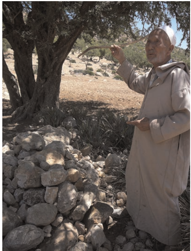
Figure 5 : Cairn servant de borne de forestier dont l'histoire est racontée par cet homme âgé à Imi n Tlit dans la région d'Essaouira (Romain Simenel 2009)

Pour exemple, d'apparence continue, le paysage forestier dans le Haut pays du plateau central est troué par une multitude de clairières (Aderghal 1993) qui, selon Beaudet, s'apparente à « une mosaïque de plans chauves et de pentes boisées » (1979:9). L'utilisation agricole de la forêt sous forme de clairières est ancienne et suit le mouvement du défrichement et de l'abandon : elle obéit à une logique qui s'oppose à toute forme de limite entre espace forestier et agricole. Dans le Souss, la forêt d'arganiers doit sa régénération en partie au cycle de terrassement et d'abandons des terres de montagnes obéissant à l'histoire des migrations humaines