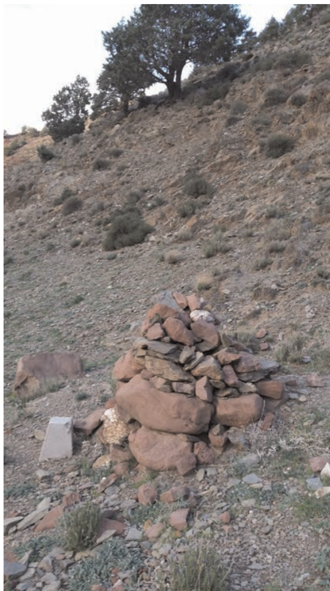
Figure 8 : Borne de délimitation forestière détruite située en plein pâturage collectif à Imi n Tlit

La borne peut être construite en pierre sèche, généralement un cairn cylindrique de près de 60 centimètres de diamètre et 80 centimètres de haut, avec le numéro de la borne inscrit du côté opposé à la forêt. Elle peut également être confectionnée en béton armé avant sa mise en place (figure 8). Les bornes sont accompagnées de deux fossés ou murettes de direction, d'environ un mètre de long de part et d'autre de la borne et indiquant la direction des bornes voisines. Les bornes sont levées au fur et à mesure de leur pose avec des appareils topographiques des plus rudimentaires au début aux plus sophistiqués actuellement, pour avoir le plan de la forêt délimitée. Certaines forêts sont délimitées sans indication de l'orientation (en degré ou en grade) avec pour seule information la distance et la direction entre deux bornes successives (N-NE par ex), ce qui rend la recherche d'une borne disparue très difficile, voire impossible, surtout si la distance entre les bornes est importante. Quand le travail est fait par des géomètres professionnels, le levé porte sur les coordonnées de la borne et son rattachement au système géodésique, donnant au travail une